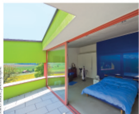
Oliver Meier, photographe