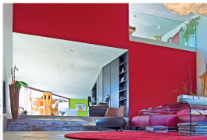
Oliver Meier, photographe