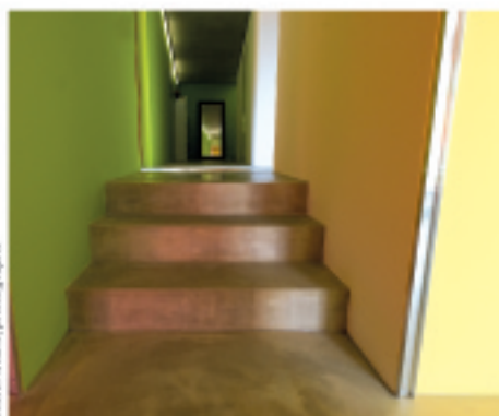
Oliver Meier, photographe